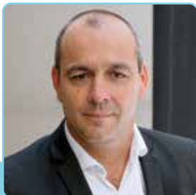
Laurent Berger secrétaire général de la CFDT

Ce réseau CFDT sera présent tout au long de votre mandat pour vous donner les moyens d'être des élu-es CFDT compétent-es et investi-es.